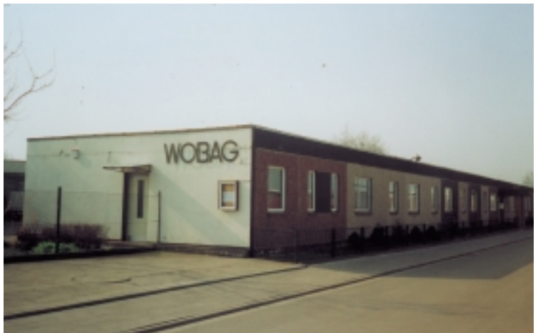
Bis April 1999 genutzte Geschäftsstelle in der Käthe- Kollwitz-Straße 6

Von diesem Tag an war die WOBAG ein eigenverantwortliches Wirtschaftsunternehmen, das straff und gut organisiert werden muß, um konkurrenzfähig zu bleiben und am Markt Erfolg zu haben. Erfolg wird in der Wirtschaft an Renditen gemessen. Doch der Kapitalgewinn von Baugenossenschaften besteht weniger in Zinsen. Unsere Renditen heißen: Gepflegtes Wohnen mit freundlichem Umfeld, eine verbesserte Bausubstanz und Investitionen in eine gesicherte Wohnzukunft. Das wurde erfolgreich angegangen.