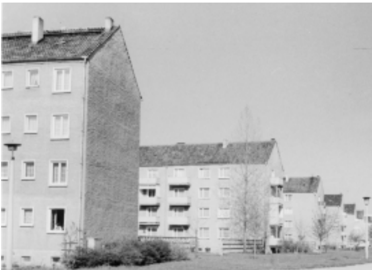
Unsanierter 4-Geschosser in der Straße der Einheit

In den Jahren 1961 bis 1967 war ein Anstieg im Wohnungsbau der Stadt und demzufolge auch in den AWG'en zu verzeichnen.