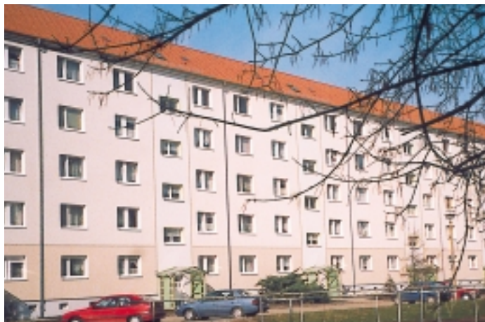
Im Jahr 1998 vollständig sanierte Wohnungen in der Thomas-Müntzer- Straße 51 – 61

In den Jahren 1974 – 1977 wurden 290 Wohnungen durch die Genossenschaft in der Thomas-Müntzer-Straße errichtet.