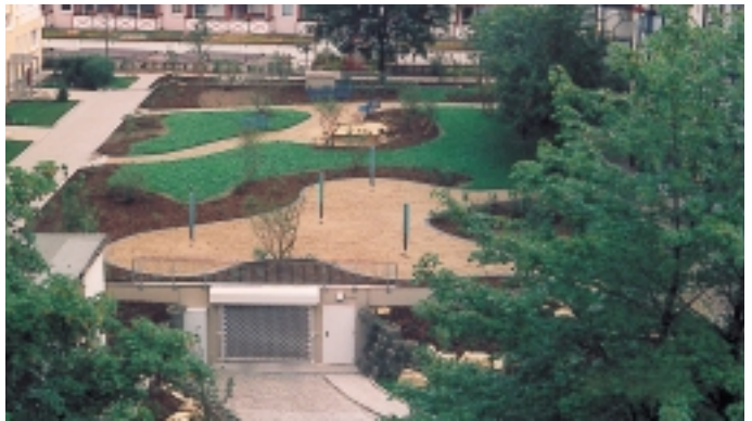
Die Tiefgarage in der Albert-Einstein-Straße ist die erste ihrer Art im Wohngebiet „Neue Zeit“