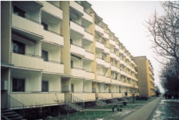
Lucas-Cranach-Straße 42 – 80