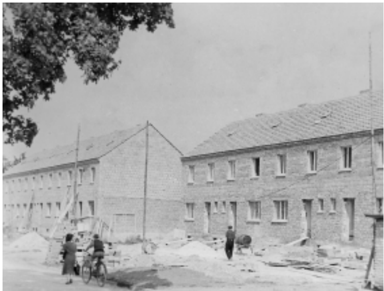
In der Erfurter Straße sind die ersten Reihenhäuser der AWG „Aufbau“ roh- baufertig

Die ersten Häuser, die diese AWG'en bauten, waren die Reihenhäuser in der Erfurter Straße, Friedrich-Ebert-Straße, Walter-Rathenau-Straße, Bertolt-Brecht-Straße und Heinrich-Heine-Straße in Sömmerda.