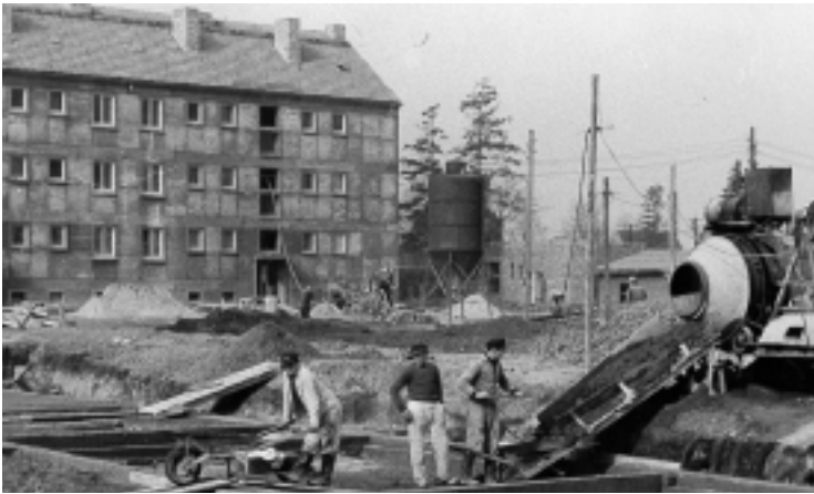
Erster Block in der Straße des Aufbaus. Die Baugrube für einen weiteren Block wird ausgehoben

Danach wurden die ersten größeren Wohnblocks in der Straße des Aufbaus durch die AWG „Rheinmetall“ gebaut. Durch die AWG „Aufbau“ wurde der Block in der Karl-Marx-Straße errichtet.