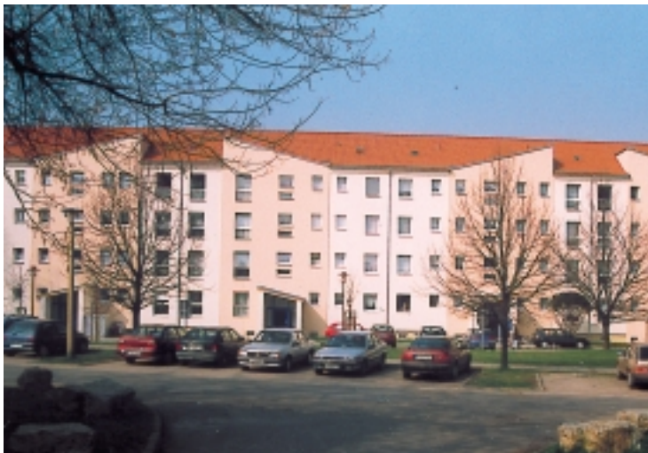
Verwirklichung individueller Lösungen im Modernisie- rungsgeschehen in der Straße der Einheit 42 – 48

Ende der 60er, Anfang der 70er Jahre setzte sich der Bauboom fort – nicht nur in dem Stadtteil „Neue Zeit“ – und es entstanden Wohnungen für unsere AWG in der Albert-Schweitzer-Straße, Thomas-Müntzer-Straße und Lucas-Cranach-Straße. Wichtig ist zu erwähnen, daß die Wohnungen in der Albert-Schweitzer- und Lucas-Cranach-Straße erstmals mit Fernwärme ausgestattet waren.