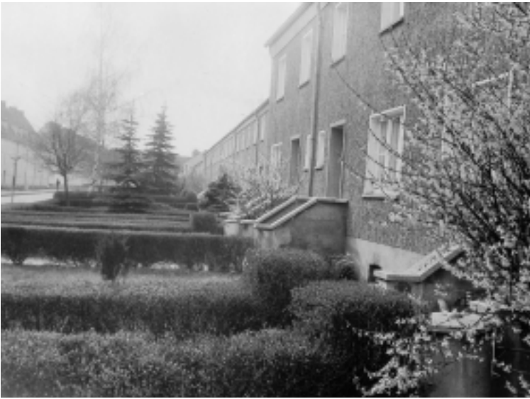
Reihenhäuser in der Friedrich-Ebert- Straße

in Sömmerda gebaut wird. Gleichzeitig wurden die Wohnungstypen vorgestellt, die in den Jahren von 1958 bis 1960 errichtet werden sollten. Im Februar 1958 wurden 378 AWG-Mitglieder registriert, von denen bereits 187 eine neue Wohnung in Besitz nehmen konnten. Im gleichen Jahr erfolgte die Erschließung des 1. Baugeländes im künftigen Wohngebiet „Neue Zeit“.