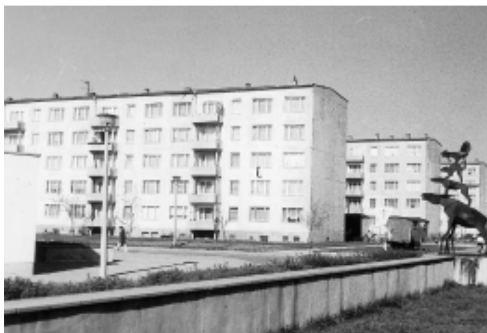
In den Jahren 1966/67 entstandene 5-Geschosser in der Albert-Einstein-Straße