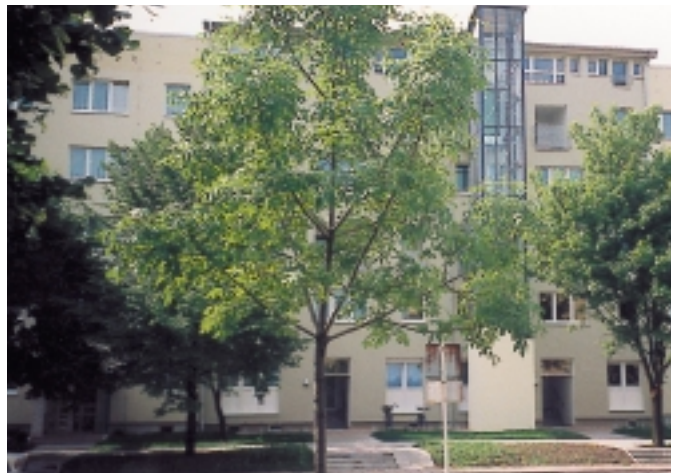
Maßgeschneiderte modernisierte Eigentumswohnungen in der Albert-Schweitzer- Straße 27 – 29