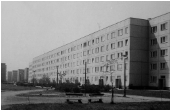
Der Wohnblock Lucas-Cranach-Straße 2 - 40 war 1979 der östliche Abschluß des Bauprogramms

Von 1970 bis 1975 entstanden in der Albert-Schweitzer-Straße und Lucas-Cranach-Straße weitere 850 Wohnungen.