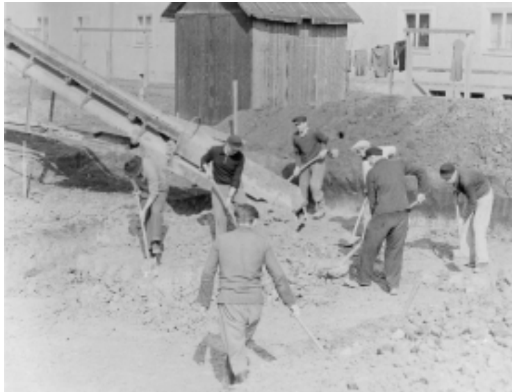
Mit Hacke und Schaufel wurde die Baugrube über ein Förderband ausgehoben

Baumaterial und nicht zuletzt durch die Mitarbeit von Fachleuten in den einzelnen Gewerken erbracht. Diese Arbeiten fanden unter sehr schwierigen Bedingungen statt und brachten nur geringes Entgelt zur Begleichung der Eigenleistungen. Eine finanzielle Abgeltung wurde erst weit später möglich. Aus den geschilderten Tatsachen läßt sich natürlich auch ableiten, daß zu dieser Zeit, trotz Anwendung der Großblockbauweise, nur 2- und 3-geschossige Bauten errichtet werden konnten. Erst ab 1966 wurde mit den nunmehr weltbekannten Plattenbauten begonnen.