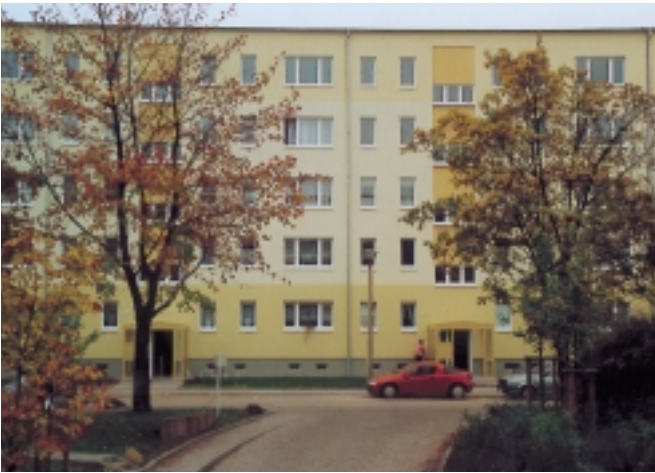
1998 wurde die Wohnanlage in der Albert-Einstein-Straße 19 – 27 komplex modernisiert