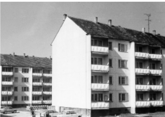
Die Karl-Liebknecht-Straße in der Klingersiedlung Ende der 70er Jahre