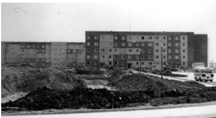
Das Salzmann- Wohngebiet Anfang der 80er Jahre.

Im Jahre 1984 waren im Wohngebiet Offenhain die ersten 192 Wohnungen bezugsfertig.