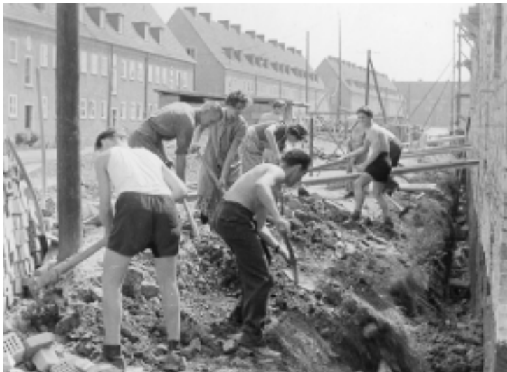
Ableistung von Eigenleistungen durch Handarbeit

Da zu diesem Zeitpunkt noch wenig Großtechnik für den Wohnungsbau zur Verfügung stand, wurden die zur Pflicht gemachten Eigenleistungen durch die Mitglieder in Handarbeit, z. B. beim Schachten und Ausheben der Fundamente, Mitarbeit in der Ziegelei bei der Herstellung von Ziegelsteinen und Dachziegeln, Handlangerarbeiten beim Transport von