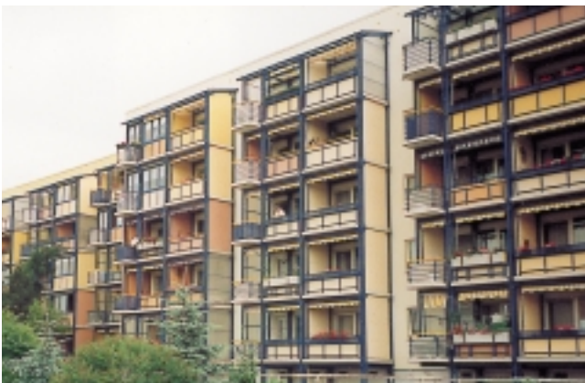
Ein schöner Balkon macht so manche Wohnung erst richtig rund, so wie hier in der Albert-Schweitzer-Straße 1 – 43