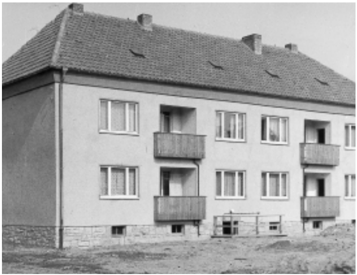
Ein Zwei-Geschosser in der Schillerstraße

Die Trägerbetriebe, die diese Unterstützung – aus welchen Gründen auch immer – nicht ausreichend gewährten, wurden nicht nur drastisch ermahnt, sondern auch zur Verantwortung gezogen. Sie wurden z.B. zu Vorstandssitzungen der AWG'en zwecks Rechenschaftslegung geladen. Die Konsequenzen reichten bis zur Verweigerung von Wohnungseinheiten für diese Betriebe.